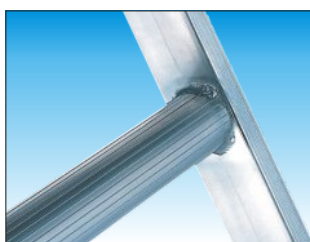
Piolo tondo Ø 50,8 con superficie anti-scivolo per la Serie 1967 - 1968