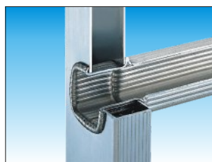
Attacco piolo - montante con doppia bordatura