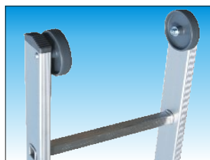
Rotelle di scorrimento per appoggio a muro