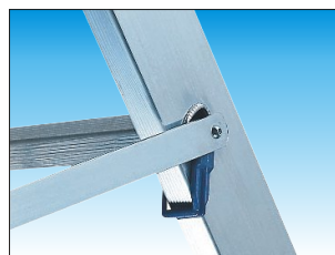
Barre distanziatrici regolabili in alluminio