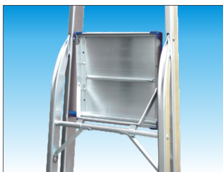
Rifiniture anti-graffio nei punti di appiglio