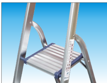
Piattaforma auto-bloccante in alluminio mm. 250 x 260 con protezioni in polietilene