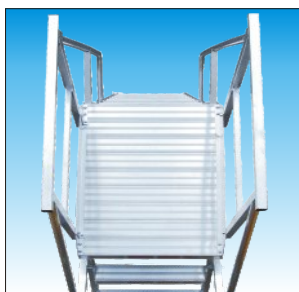
Piattaforma provvista di fermapiedi e parapetto regolamentare di mt.1