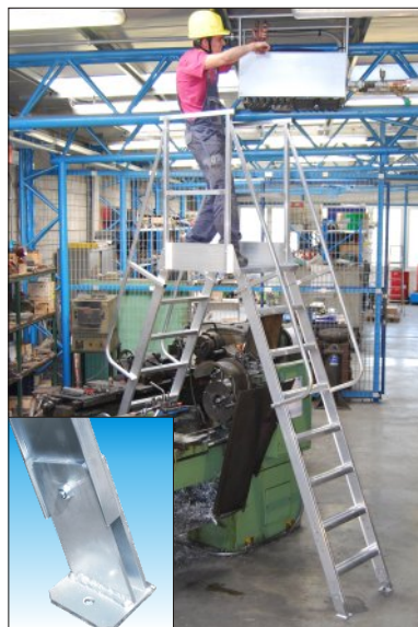
Su richiesta: Scala 6088 P - Versione FISSA (senza basette e maniglie) con piastre per il fissaggio obbligatorio a pavimento.