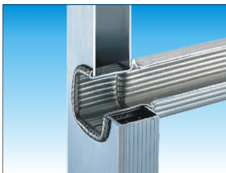
Attacco gradino - montante con doppia bordatura