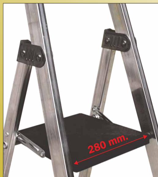
Piattaforma di riposo in PVC Di dimensioni mm. 270 x 280 con nervature in acciaio zincato di sicurezza anti-chiusura

PROFILO ERGONOMICO mm. 50 x 22 Può essere facilmente sollevata con una sola mano