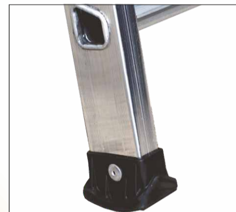
Piedini in PVC con superficie anti-sdrucolo Accoppiato al montante con rivettatura esterna