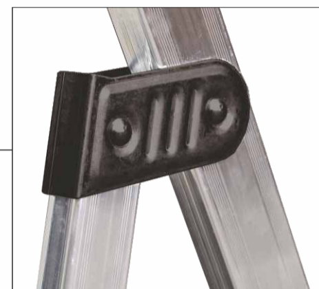
Cerniera in acciaio verniciato Cavalletto di sostegno scala assicurato da robusta cerniera in acciaio verniciato