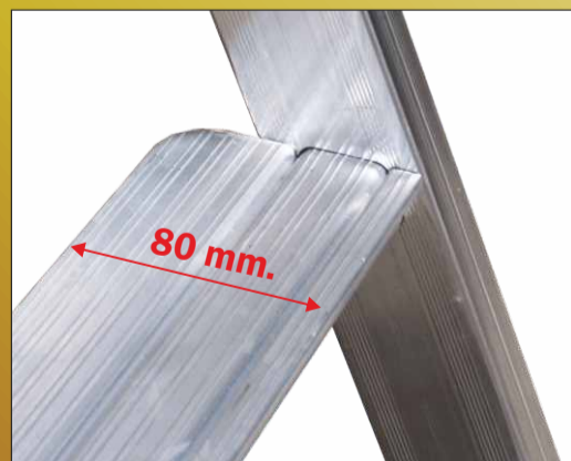
Gradino profondo 80 mm. unito al montante con bordatura esterna Realizzati in robusto profilo con superficie zigrinata anti-scivolo