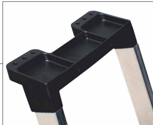
Vaschetta porta-oggetti in PVC con gancio porta-secchio Terminazione con vaschetta in PVC dotata di gancio porta-secchio con portata massima 4 kg.