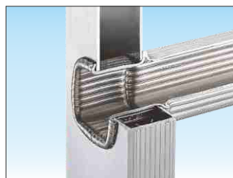
Attacco piolo-montante con doppia bordatura interna ed esterna