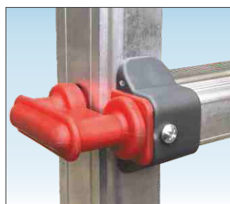
Regolazione altezza piano mediante ganci in acciaio rivestiti in nylon