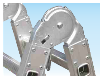
Cerniere in acciaio ad arresto automatico e sblocco rapido