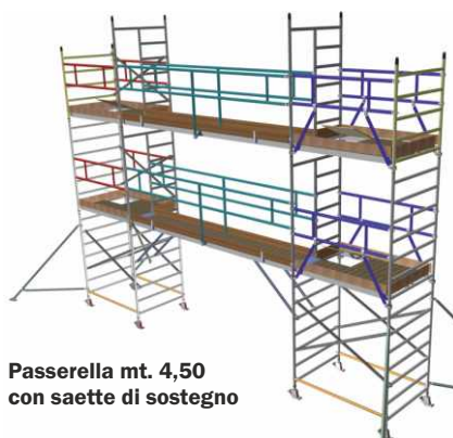
Passerella mt. 4,50 con saette di sostegno