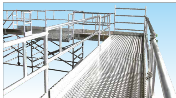
Passerella con superficie in lamiera mandorlata di alluminio

Su richiesta: Superficie passerella e fermapiedi in lamiera di alluminio mandorlato