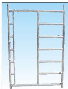
Montante di passaggio