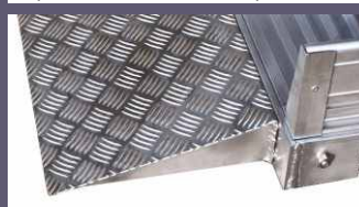
Finitura terminale inclinata a 15° realizzata in lamiera mandorlata di alluminio consente il transito su ruota