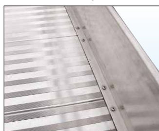
Superficie di calpestio anti-scivolo e anti-tacco realizzata in robusto profilato di alluminio anti-ruggine consente il passaggio anche con tacchi da donna.

Il montaggio e lo smontaggio del fermapiEDE è semplice e rapido, grazie allo speciale sistema di fissaggio ad incastro