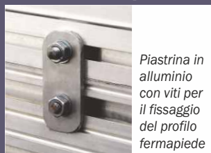
Piastrina in alluminio con viti per il fissaggio del profilo fermapiEDE