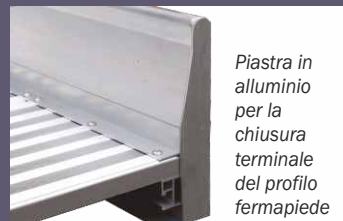
Piastra in alluminio per la chiusura terminale del profilo fermapiEDE