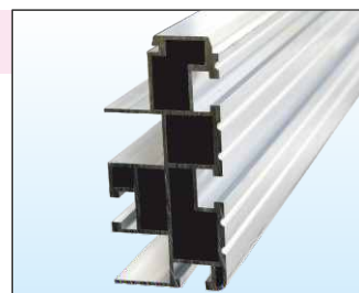
Profilo montante ad alta resistenza auto-portante fino a 6 mt provvisto di tracce guida permette la massima regolazione durante la messa in opera.