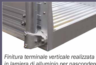
Finitura terminale verticale realizzata in lamiera di alluminio per nascondere l'apertura sottostante alla piattaforma