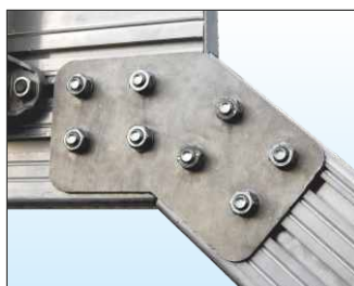
Robuste piastre realizzate 100% in alluminio anti-ruggine consentono un facile collegamento tra i diversi moduli mediante viti e bulloni in acciaio INOX.

Il montaggio e lo smontaggio del fermapiEDE è semplice e rapido, grazie allo speciale sistema di fissaggio con incastro a clip, che rende possibile l'installazione di componenti lunghi anche mt. 6,00, utilizzando solamente n° 1 piastrina di fissaggio.