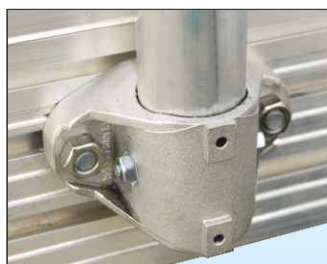
Telai di protezione ad installazione rapida mediante supporti in fusione d'alluminio a posizione regolabile durante la messa in opera.