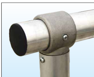
Parapetto realizzato in tubo Ø 50 mm con giunzioni in fusione di alluminio anti-ruggine fisse o snodabili per consentire cambi di direzione e di quota.